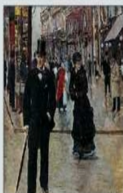
Paris à la Belle Époque, représenté par le peintre Jean Béraud

C'est une époque de prospérité économique et d'intense création artistique, littéraire et scientifique. D'importants mouvements artistiques (impressionnisme, fauvisme, cubisme, surréalisme) naissent en France. Paris devient la capitale mondiale des lettres et des arts.